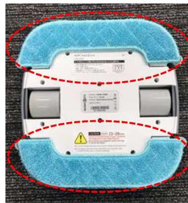
ナビゲーションユニットにクリーニングパッドを取り付けてしまっている