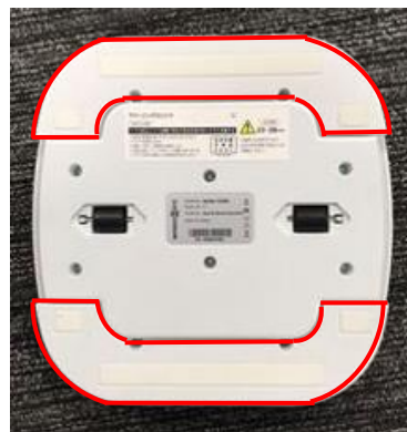
クリーニングユニット