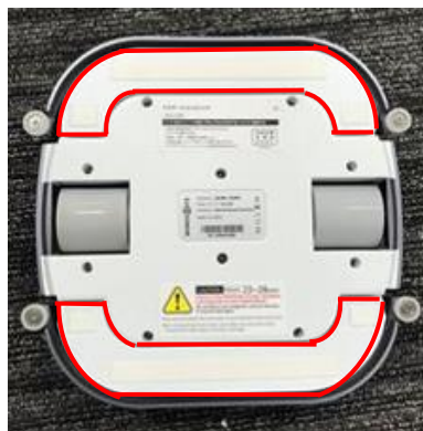
ナビゲーションユニット